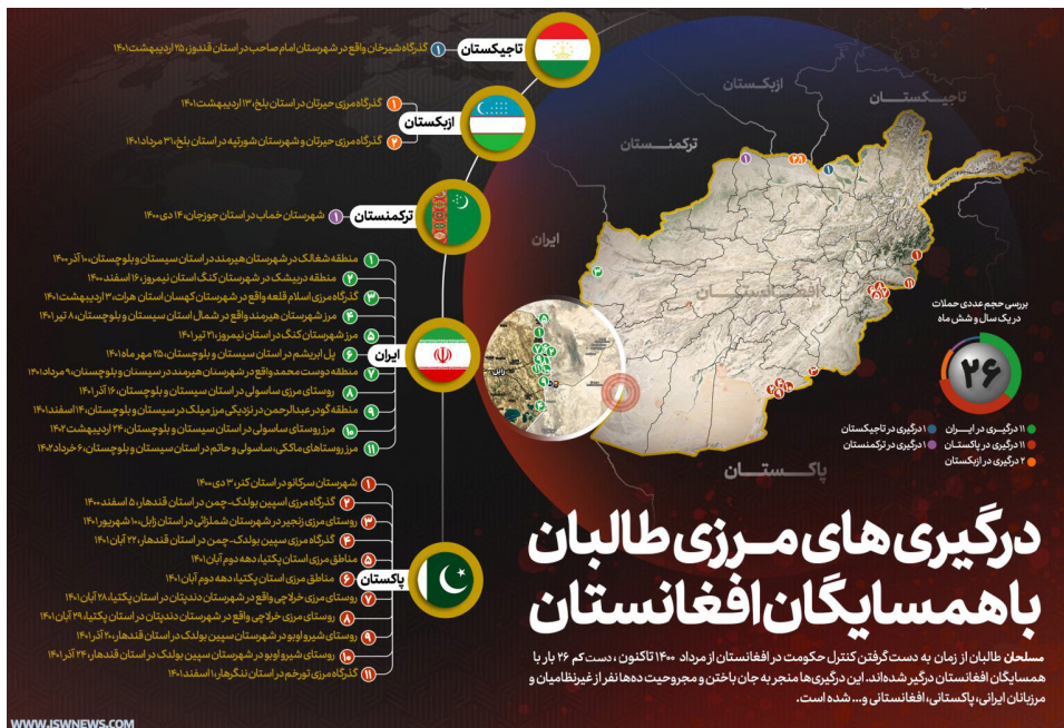
شکل ۱- اینفوگرافی درگیری‌های مرزی طالبان با همسایگان افغانستان

– ناامنی‌های مرزی و تعطیلی بازارچه‌های مرزی ۲ : از زمان تسلط نیروهای طالبان بر افغانستان و تحویل پست‌های مرزی این کشور با ۶ کشور همسایه، نیروهای