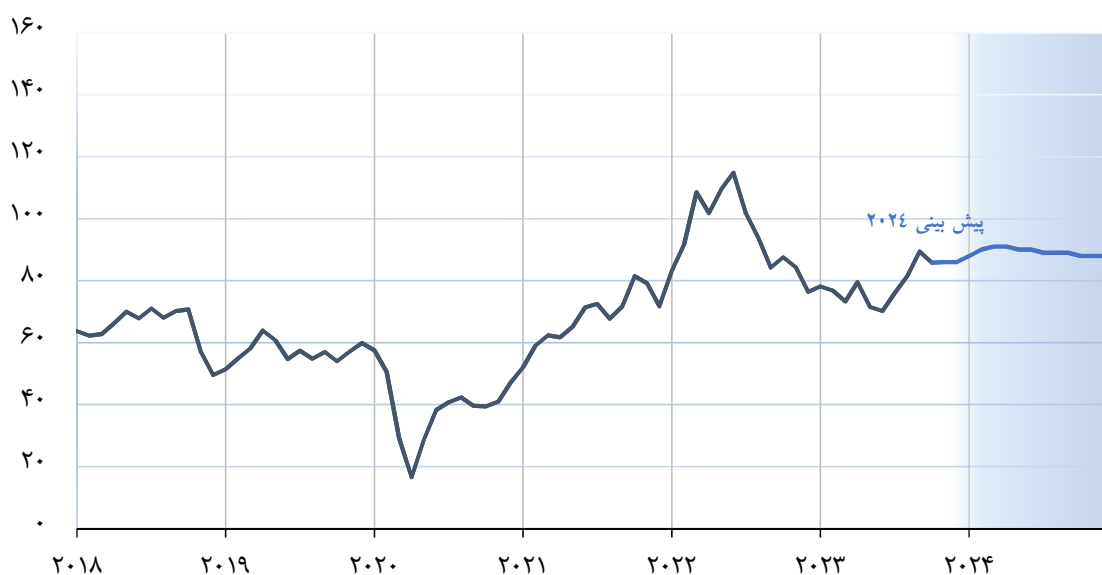
نمودار ۲- پیش‌بینی روند قیمت جهانی نفت در سال ۲۰۲۴