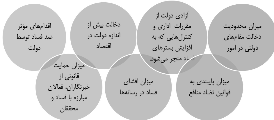
شکل ۱- موارد مدنظر بنیاد خانه آزادی برای تخمین میزان فساد در بین دولتمردان

مأخذ: مرکز بررسی‌های استراتژیک ریاست‌جمهوری.