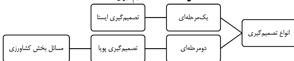
شکل ۱- اشکال تصمیم‌گیری